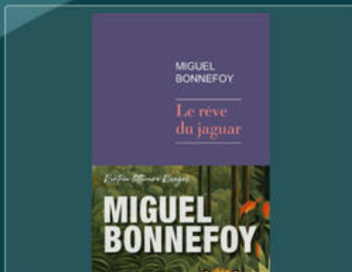
C Le rêve du jaguar