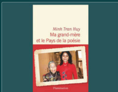
E Ma grand-mère et le pays de la poésie