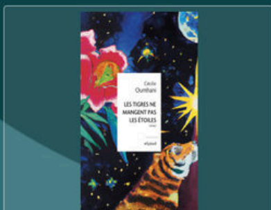
A Les tigres ne mangent pas les étoiles

1 → Cliquez sur le livre que vous venez de lire pour lui attribuer une note et un commentaire *