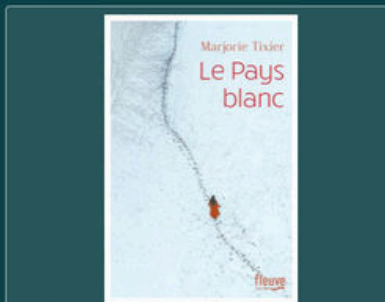
D Le pays blanc