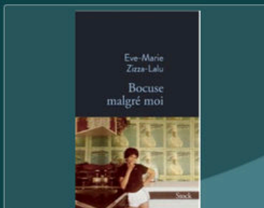
F Bocuse malgré moi